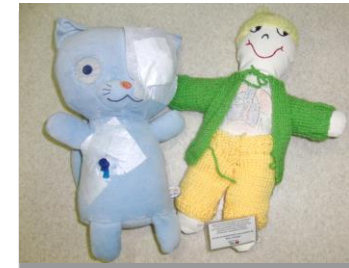
Ninots de drap i joc simbòlic